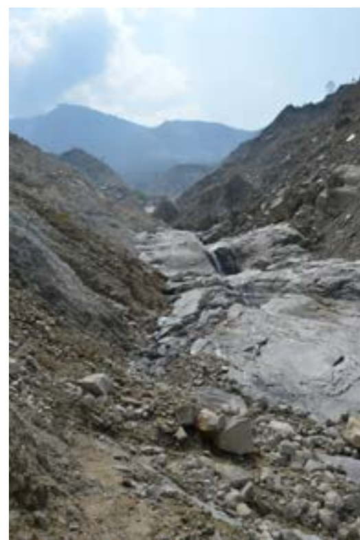
Jordbävningen orsakade också enorma jordskred. Där det tidigare fanns bördiga sluttningar och hus finns idag bara sten och grus.