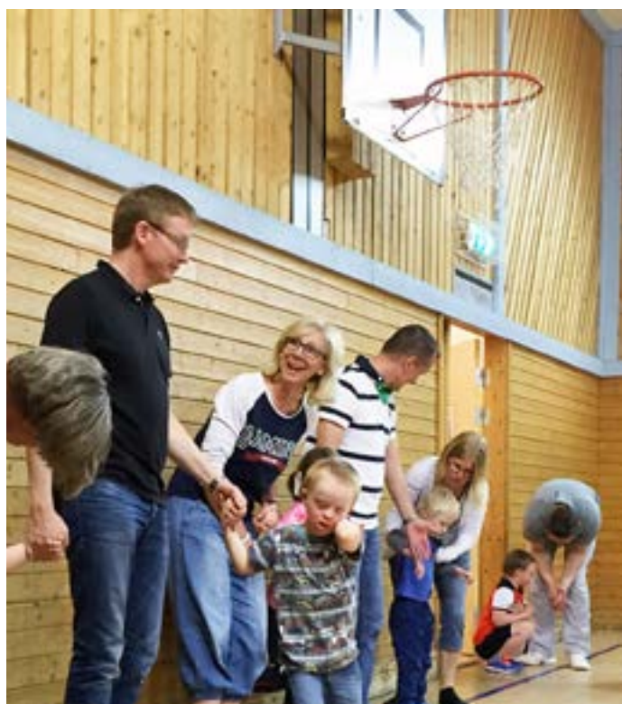
”Röris” vid FUB i Jönköping.

Höstens ansökningsomgång är öppen redan nu och fram till och med den 1 september. Kriterier och annan information finns på www.radiohjalpen.se